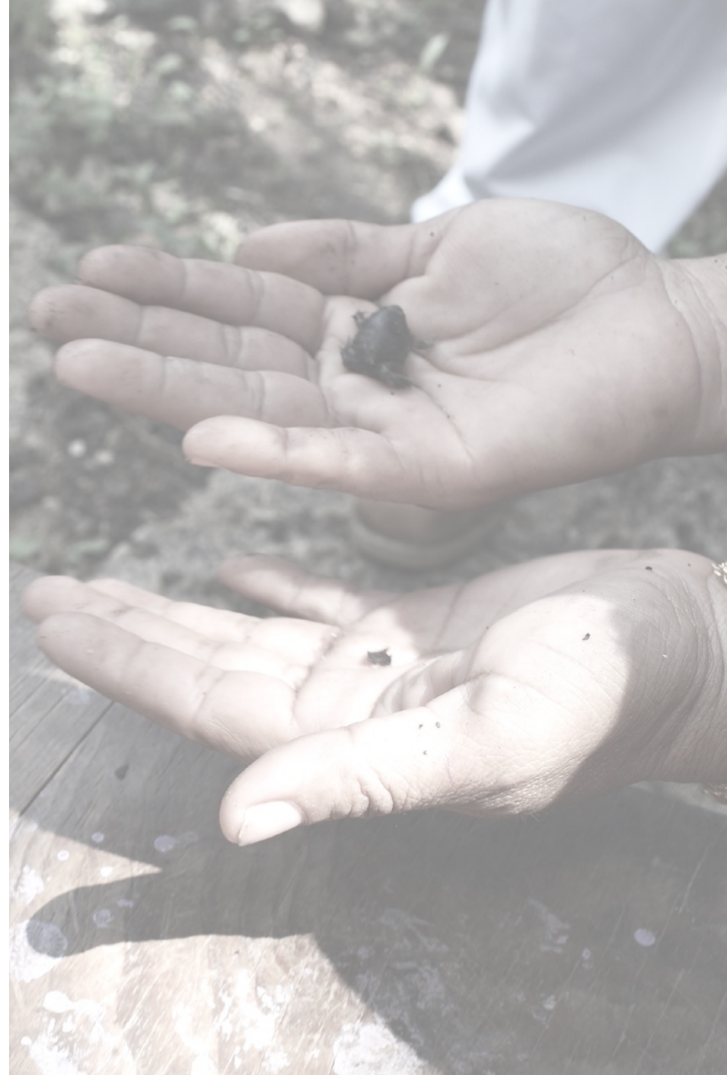
Sapo borracho, especie bajo protección especial NOM 059 Semarnat Ejemplar encontrado en el patio de un beneficiario del proyecto estratégico

Mérida, Yucatán, México Informe anual de actividades 2019-2020 Imágenes cortesía CNN reportaje 2021 www.hunab.info